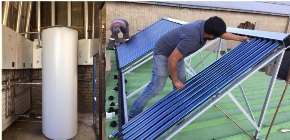
Incorporación equipos de eficiencia hídrica y energética