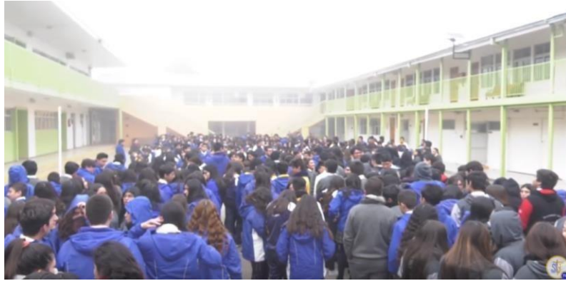
Área de seguridad, ante cualquier situación de emergencia o desastre natural

Reducción del riesgo de desastres ante el cambio climático.