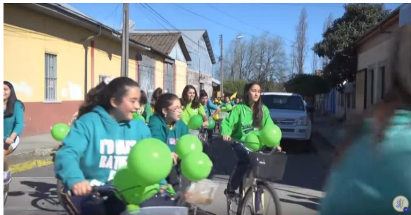
Acciones de reducción de emisiones contaminantes