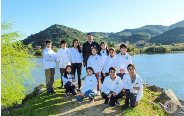
Creación de brigadistas medio ambientales – forjadores ambientales